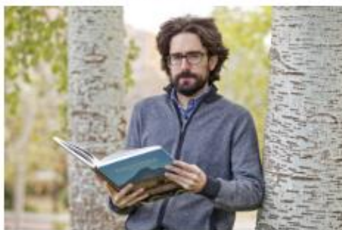
El llibre veig un estudi panoràmic de les 10 poblacions de Penyagolosa.

La idea surge a raíz de la Càtedra Diputació de Castelló de Centres Històrics i Itineraris Culturals de la Universitat Jaume I. En 2016 se materializa la Càtedra para estudiar cuestiones del patrimonio material e immaterial de Penyagolosa. Entonces, se van plantea la idea de analizar per un lado les regalives, la candidatura a Patrimoni Mundial que se planteja sobre les peregrinacions de Les Orenes y Culla... y a partir de ahí el treball va evolucionant per analitzar algunes construccions vinculades a esos cambios matrius, paviments, elements orogràfics que formen part de esos regalives. Les regalives passen per aquests canvis per algo: perquè vivia gent, perquè eren punts de incidència de les regalives, de les propies plagaris. Y clar, veiem que aquell no son simplement regalives, sino una forma de habitar Penyagolosa, una forma de viure en la muntanya.