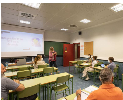
Imatge 1. Fotografia de la primera sessió del curs

L'objectiu d'aquest curs va ser formar el professorat sobre la integració en la docència de l'Agenda 2030 i els seus ODS. La transversalització dels ODS a la docència permet fer una contribució proactiva a l'Agenda 2030, així com complir i reforçar la responsabilitat social universitària i el Codi ètic. Així mateix, va ser una oportunitat per promoure la innovació educativa, actualitzar els continguts i dinamitzar els enfocaments metodològics aplicats tant en els processos d'ensenyament-aprenentatge com en els d'avaluació. La metodologia aplicada va combinar presentacions teòriques amb exercicis pràctics i debat.