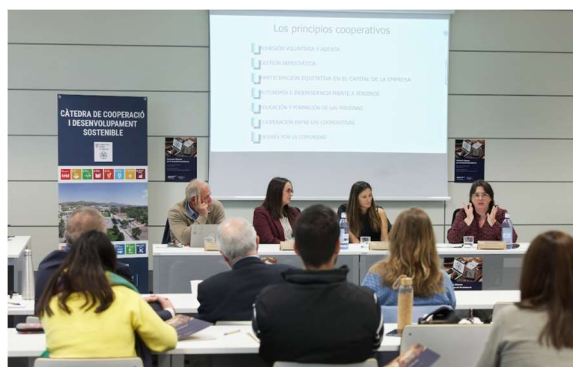
Imatge 6. Fotografia de la taula redona del suport a l'emprenedoria

Finalment, el seminari va comptar amb un espai de debat entre les persones participants en les anteriors sessions i les entitats convidades (l'Oficina d'Inserció Professional i Estadies en Pràctiques, La Niuada, el cap del Servei de Promoció Econòmica i Relacions Internacionals, la tècnica en Sostenibilitat Empresarial de la Diputació de Castelló i Low Carbon Economy).