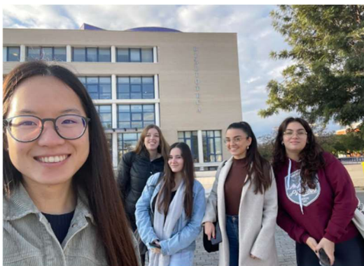
Imatge 2. Fotografia facilitada per les participants