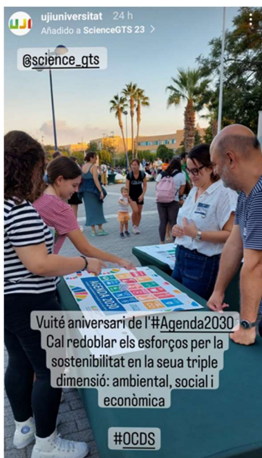
Imatge 7. Captura de les xarxes socials de l'UJI