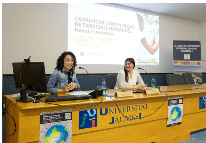
Imatge 5. Fotografia de la primera conferència