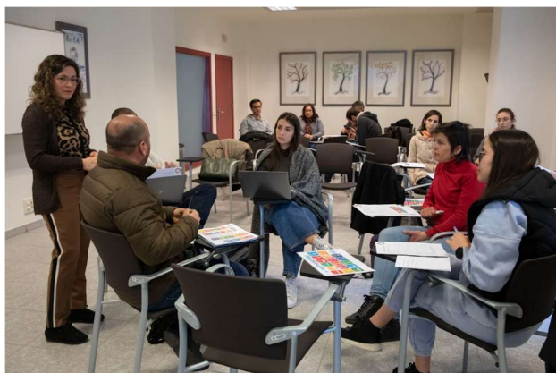
Imatge 3. Fotografia del taller

orientar el professorat en la introducció dels ODS a l'aula amb continguts curriculars tot seguint metodologies aplicades actives i participatives; desenvolupar tècniques i estratègies participatives per a treballar els ODS en les aules; aprendre a crear i facilitar situacions d'aprenentatge amb la incorporació transversal dels ODS i facilitar metodologies pròpies actives i participatives. Aquest taller va comptar amb 22 persones inscrites de les quals 17 van obtenir el certificat d'aprofitament.