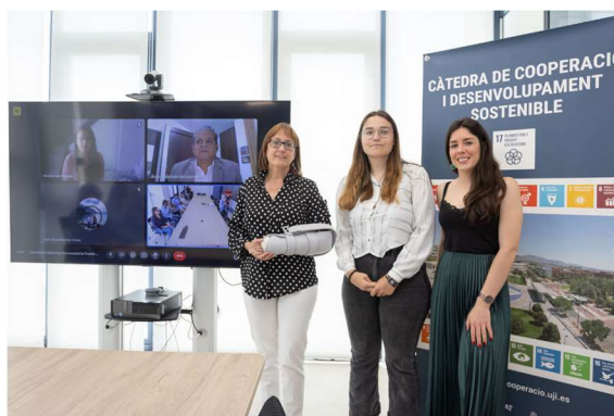
Imatge 5. Fotografia de l'acte de lliurament