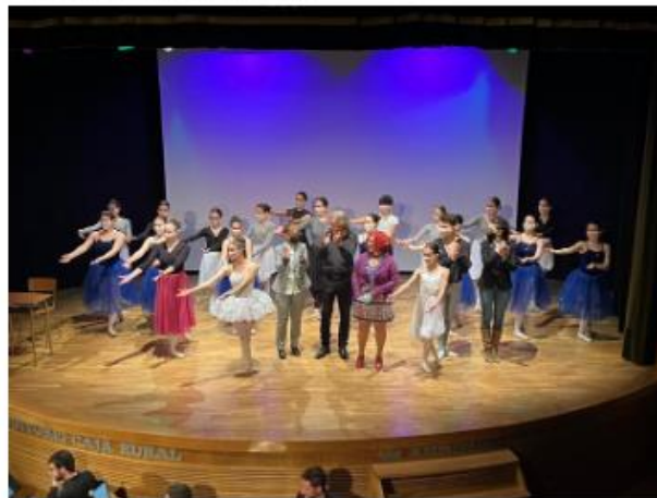
La Cátedra L'Alcora de Investigación Musical y Calidad de Vida de la UJI presenta un musical y una guía didáctica para luchar contra el acoso escolar

Inicio > Valencia > 22/06/2021 > Música de Investigación Musical y Calidad de Vida de la UJI