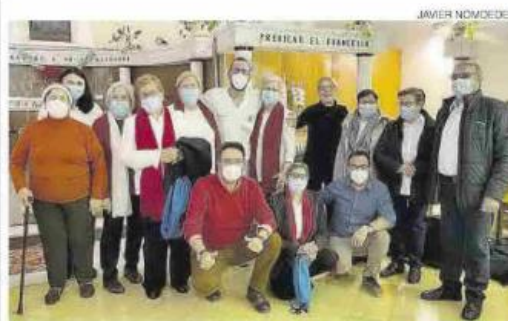
Cooperación > El equipo de la cátedra, con pacientes de La Magdalena.