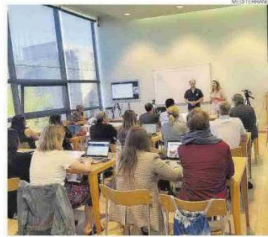
El estudio se ha expuesto en la masterclass 'Technology and Dementia'.