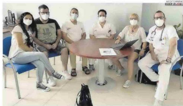
Miembros de la cátedra l'Alcora de la UJI y de la dirección del Hospital la Magdalena mantuvieron ayer una reunión.