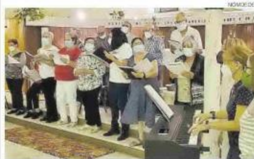
Novedoso ▶ Los participantes cantan con el proyecto Músicas para la Vida.