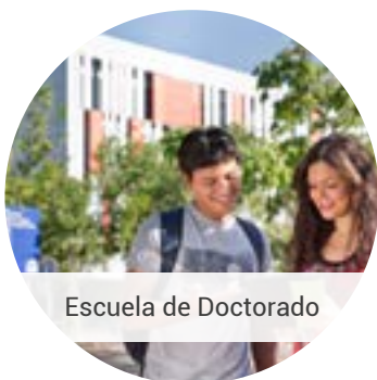
Escuela de Doctorado