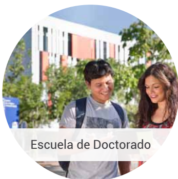
Escuela de Doctorado

Más información: Escuela de Doctorado y Consejo Social info@uji.es