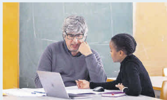
Una estudiante de arquitectura revisando un proyecto.

Este aumento de alumnado extranjero ha llevado a las universidades a aprobar un decreto para que los extracomunitarios paguen el doble por la matrícula. Esta medida ya está en vigor en prácticamente todas las autonomías de España, siendo la Comunitat Valenciana la última en aplicarla. La medida entrará en vigor paulatinamente, el coste se multiplicará un 1,5 el curso que viene y se doblará el siguiente.