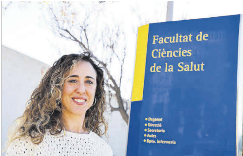
Otra de las novedades del próximo curso va a ser el nuevo grado de Logopedia.

🗣️ En estos últimos años fue devastador ver a los compañeros de cualquier ámbito, daba igual el entorno en el que trabajaban, geriátricos, hospitales... estaban devastados. Cuando te cruzabas con ellos por la calle, no había día en que, al hablar con ellos, no se rompieran. Debemos tener en cuenta que el Covid impactó en ellos a nivel biológico, social y psicológico. Es verdad que en algunos casos la Administración o grupos de voluntarios ofrecieron ayuda temprana, pero, después de lo vivido y de lo perdido, deben superar unas condiciones laborales todavía muy mejorables. No ayuda que no puedan disponer de días libres por falta de alguien que les cubra por problemas económicos o estructurales de la Administración que todos conocemos. Y no podemos mirar a otro lado, porque los profesionales sanitarios ya eran uno de los colectivos con la salud mental más alterada y altas tasas de suicidio; la situación postcovid no ha hecho más que agravarlo. Es la peor de las consecuencias, perder compañeros porque no tienen recursos para sobreponerse o sobre-