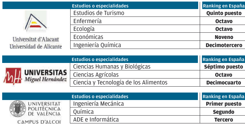
Fuente: Academic Ranking de Shángai