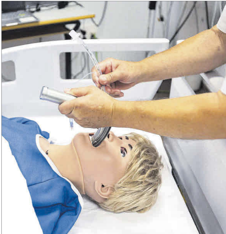
Los alumnos de Enfermería de la UA hacen prácticas en la Facultad de Ciencias de la Salud.