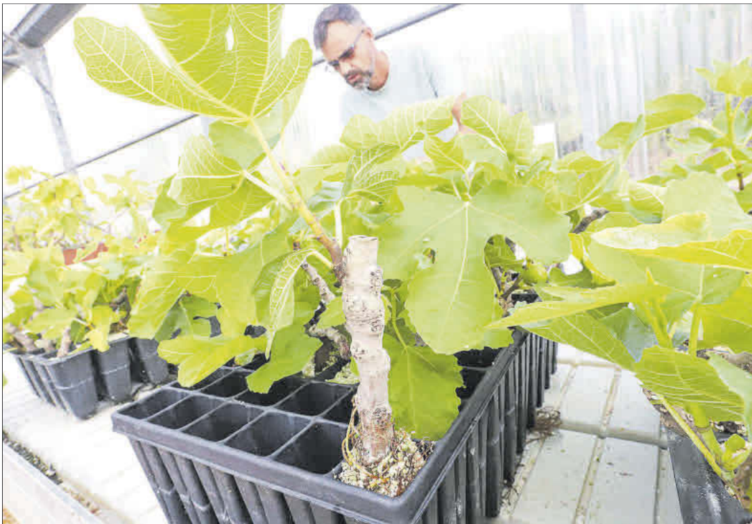
El vivero de la Escuela Politécnica Superior de Orihuela, adscrita a la UMH, que ofrece los estudios de Ciencias Agrícolas.