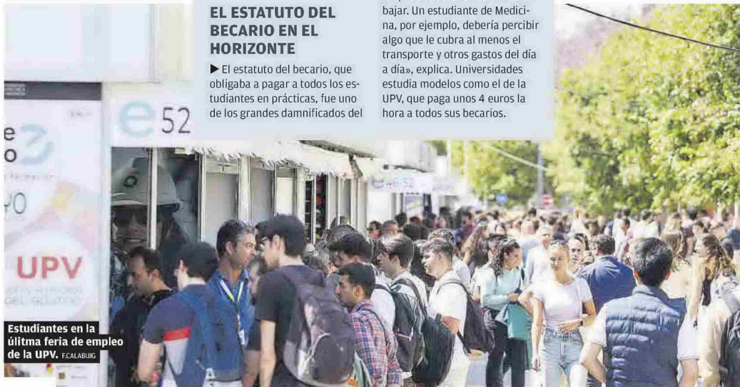
Estudiantes en la última feria de empleo de la UPV. F.CALABURG

► La secretaria autonómica de Universidades, Esther Gómez, considera que los becarios deben cobrar una pequeña cantidad al realizar sus prácticas. «No les puede costar dinero ir a trabajar. Un estudiante de Medicina, por ejemplo, debería percibir algo que le cubra al menos el transporte y otros gastos del día a día», explica. Universidades estudia modelos como el de la UPV, que paga unos 4 euros la hora a todos sus becarios.