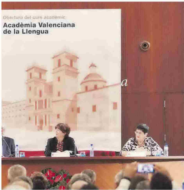
ntó, celebrado ayer en Sant Miquel dels Reis.