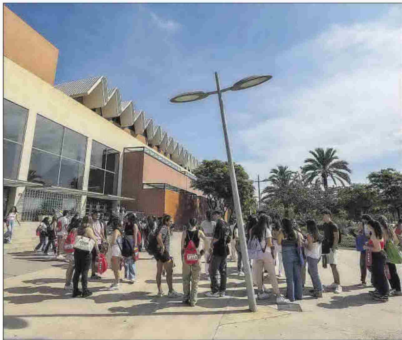
Alumnos de la UMH, frente al edificio Altabix de Elche.

Cabe destacar que la universidad privada en la Comunidad sigue presentando una mayor tasa