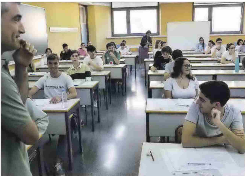
Estudiantes haciendo la PAU en un aula del Campus de la UPV en Alcoy este mes de junio.