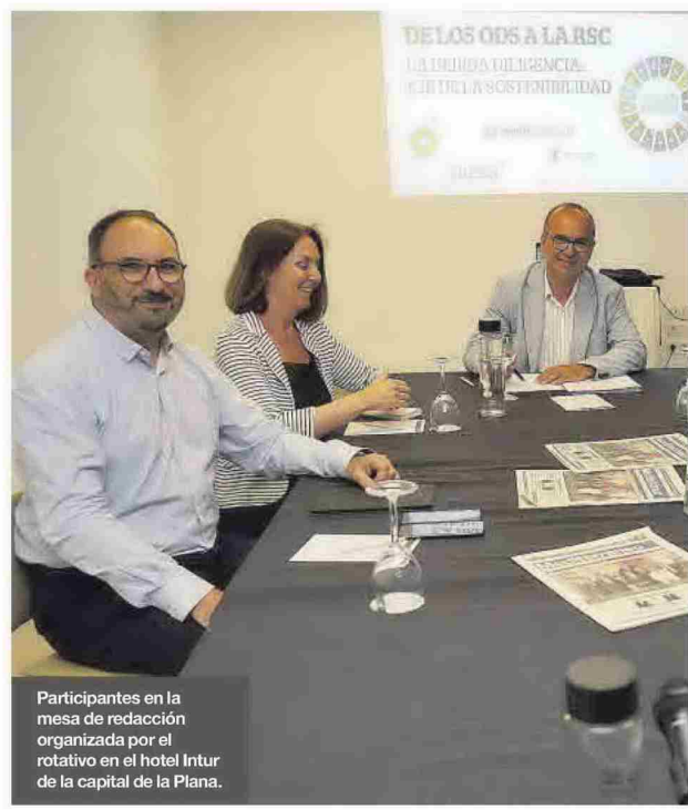
Participantes en la mesa de redacción organizada por el rotativo en el hotel Intur de la capital de la Plana.

en todo lo que concierne a la cadena de valor. «Ya no hablamos de empresas, sino de líderes en sostenibilidad que van a influir directamente en toda esa cadena y serán polos de atracción para futuras inversiones, nuevos consumidores y el resto de actores que operan en la órbita empresarial». La responsable de Sostenibili-