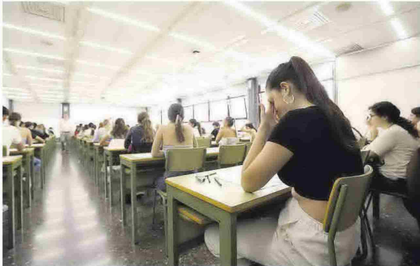
Estudiantes que se presentaron a la primera convocatoria de la selectividad de 2023-24.

Se trata del último estudiantado que cursará una PAU como las de antes, a partir del año que viene entra en juego el aprendizaje com-