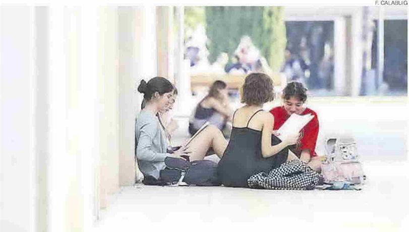
Imagen de unos estudiantes preparándose los exámenes en un campus de una universidad valenciana.

la nota de la fase obligatoria de la Prueba de Acceso a la Universidad.