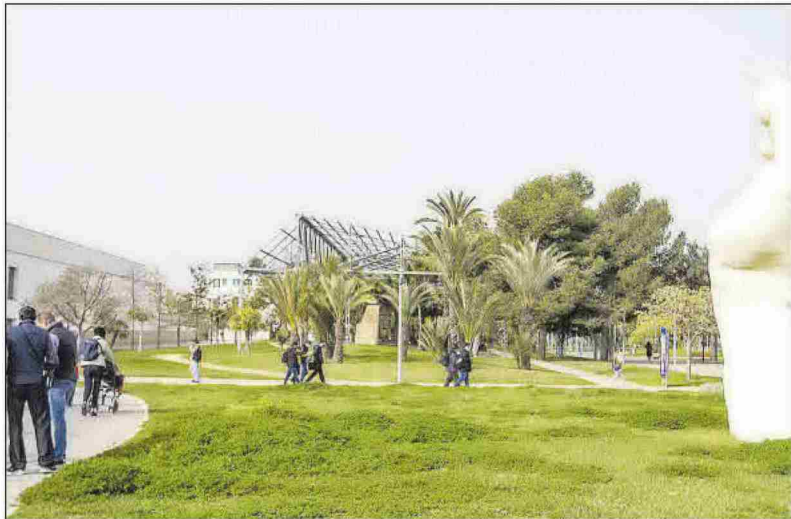
Vista general del campus de la Universidad de Alicante, en imagen de archivo.