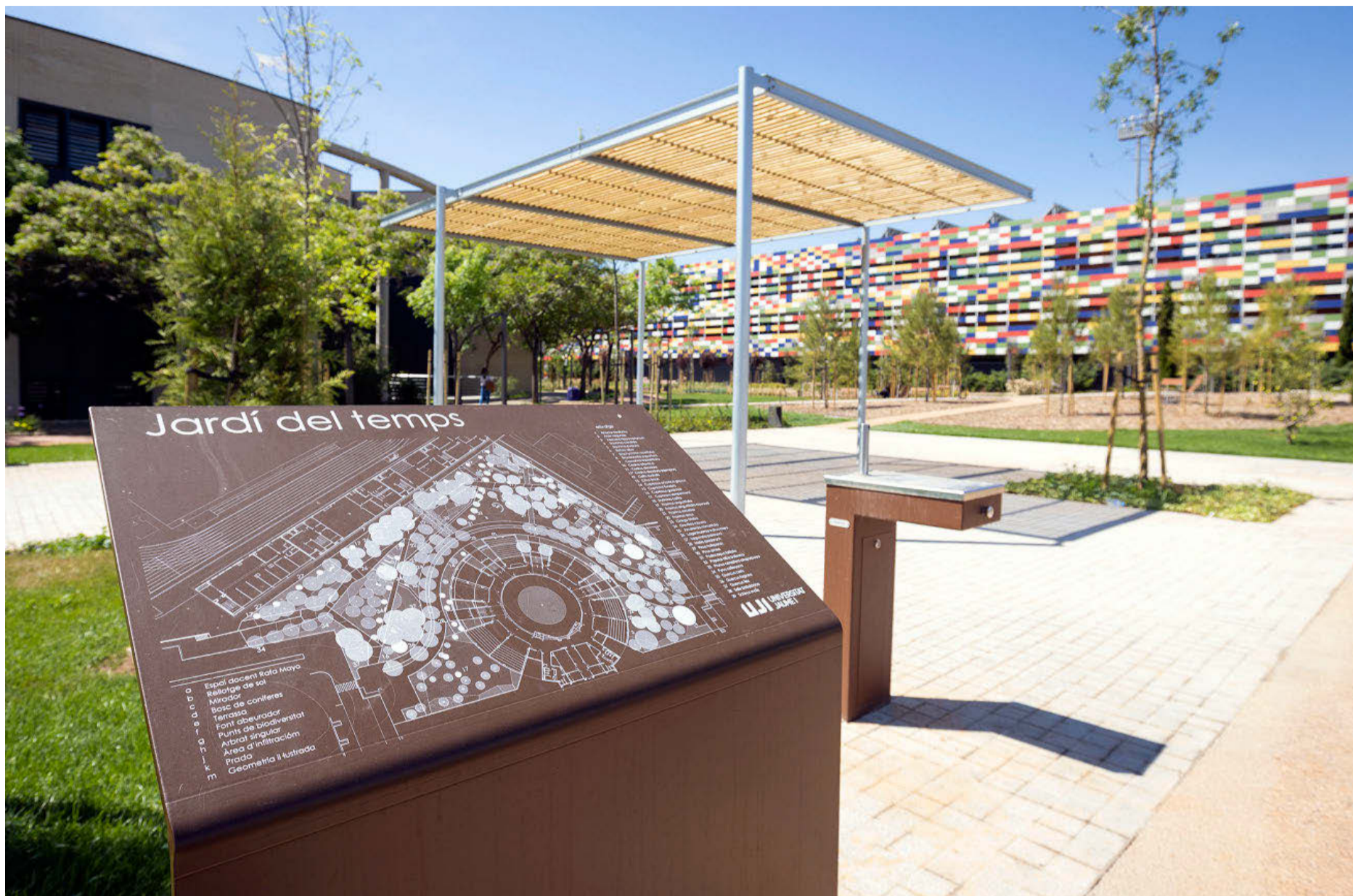
La UJI es una universidad comprometida con el entorno, con la responsabilidad social y medioambiental, implicada en proyectos sociales. C. A. D.