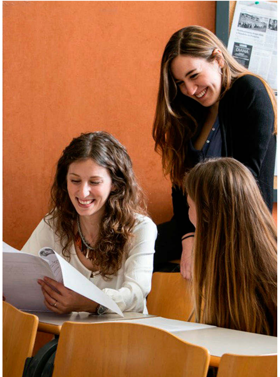
Los titulados del CEU pueden acreditar las competencias que demandan los reclutadores de talento. C. A. D.

a los reclutadores, porque, a golpe de clic, pueden acceder a las experiencias y actividades que sustentan las competencias que han reflejado los candidatos en su currículum digital.