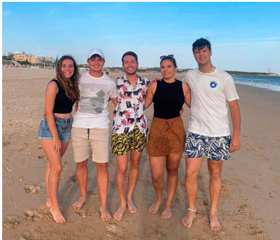
El alumnado de CoopSalus disfrutando del proyecto Erasmus+ realizado este año en Portimao y Vicenza. C. A. D.