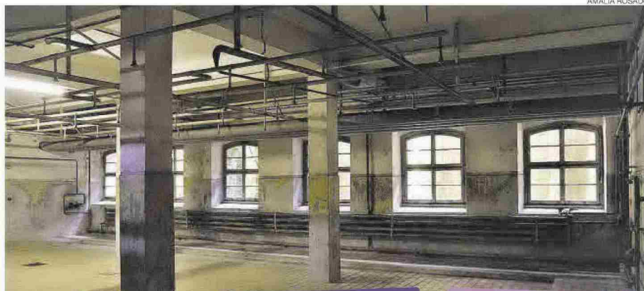
Mauthausen. Duchas del campo de concentración