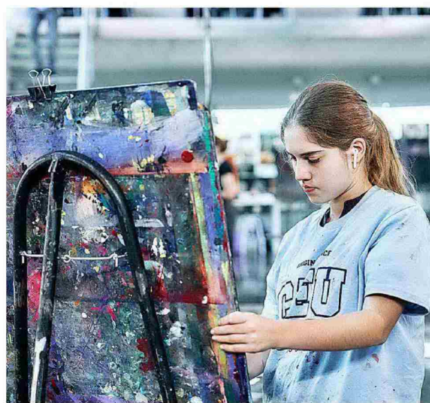
CEU SAN PABLO