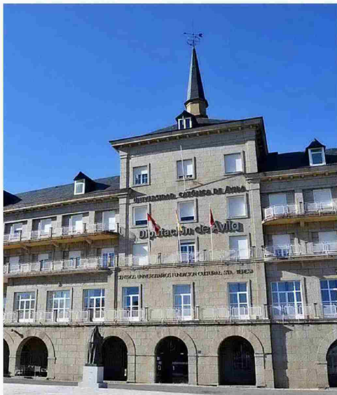
CATÓLICA DE ÁVILA

El modelo académico de aprendizaje experiencial de la Universidad Europea de Canarias tiene un enfoque eminentemente práctico y apegado a la realidad profesional. Es un modelo que combina el mejor claustro, las instalaciones más modernas y la última tecnología para que el estudiante viva la experiencia del aprendizaje en su día a día.