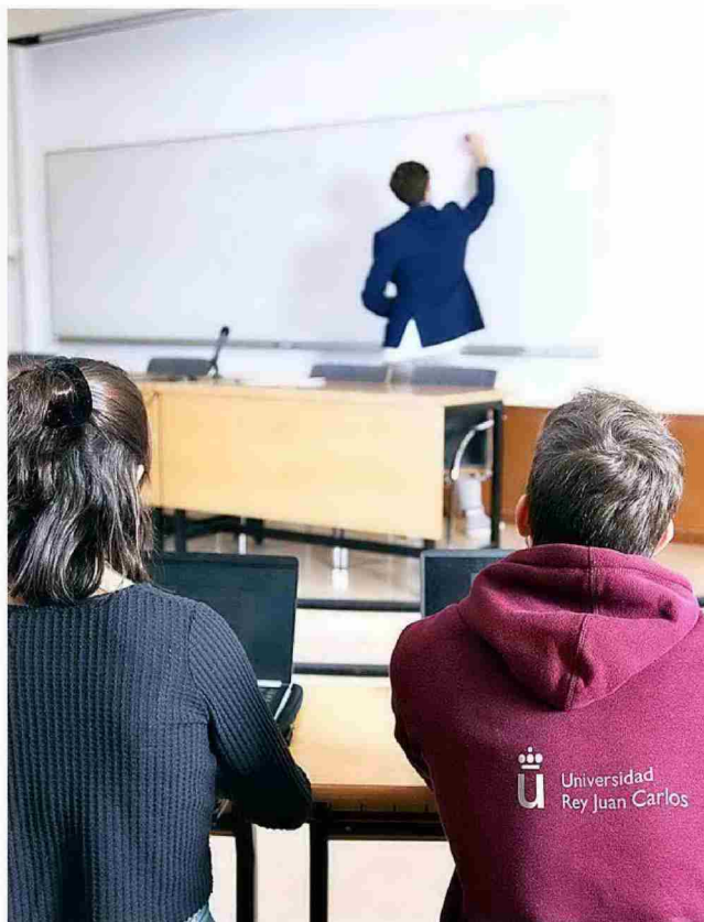
REY JUAN CARLOS

Dispone de 12 ECTS de prácticas externas obligatorias, que se realizan en organizaciones privadas y públicas durante un cuatrimestre.