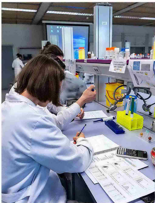
COMPLUTENSE DE MADRID

Cuenta con especializaciones en Lengua inglesa, Lingüística inglesa, Literatura inglesa, Literatura norteamericana, Crítica Literaria, etc.