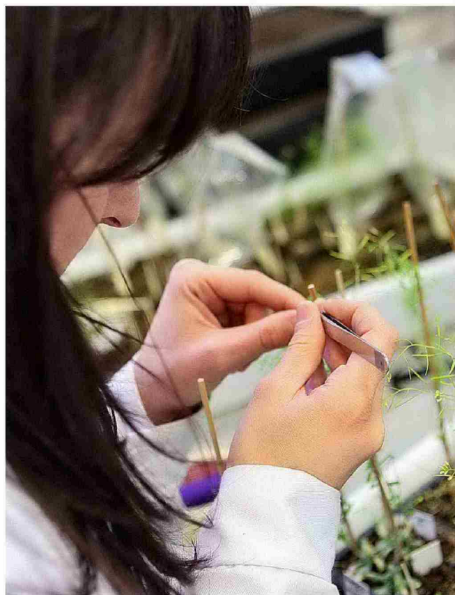
POLITÉCNICA DE MADRID

Los grados de este centro comparten 60 ECTS de optativas entre ellos, lo que facilita al alumno cursar varios títulos. Dispone de 110 plazas.