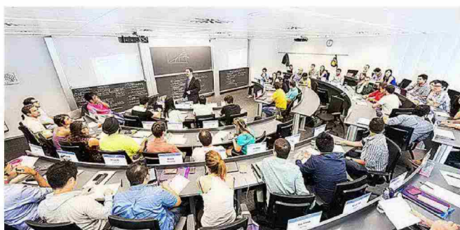
RAMON LLULL - ESADE

pularidad de esta rama, tan solo se ofertaron 35.096 plazas, lo que supuso un exiguo 14,4% del total, un hecho que los ha convertido en los grados con las notas de corte más elevadas. Según datos de la Fundación Conocimiento y Desarrollo (CYD), la demanda de alumnos interesados en estudiar Medicina se ha incrementado un 73%, mientras que el interés por la Enfermería ha crecido otro 65%. Tan solo en la universidad pública, durante ese año lectivo hubo 13,1 solicitudes por cada plaza ofertada en Medicina, a pesar de que estas aumentaron a 3% respecto al curso anterior. Y muy próxima al área sanitaria se sitúa la de Ingeniería y Arquitectura, que atrae al 17,7% de los estudiantes. Por su parte, Artes y Humanidades y Ciencias coparon un 10,5% y un 6,3% del alumnado, respectivamente. Muchos jóvenes españoles ya tienen claro lo que estudiarán el próximo curso, sea o no por una cuestión vocacional, pero otros no tanto. Estos tendrán que analizar hacia qué dirección encauzan su carrera profesional. El abanico de posibilidades es amplio. El suplemento 50 CARRERAS, fruto de un exhaustivo análisis, pretende ayudar a todos los que aún están indecisos a elegir los estudios que más se ajustan a sus preferencias.