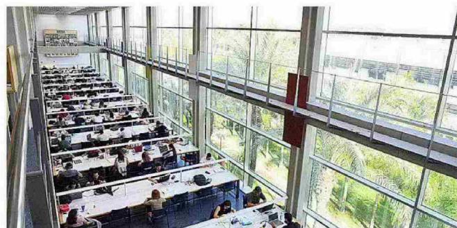
POLITÉCNICA DE VALENCIA