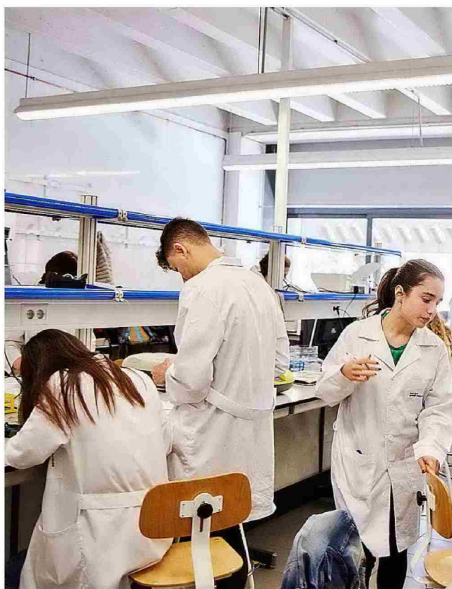
UNIVERSIDAD DE BARCELONA

Buena relación entre créditos prácticos y teóricos y modernas instalaciones. Tiene un valorado Sistema Interno de Garantía de Calidad.