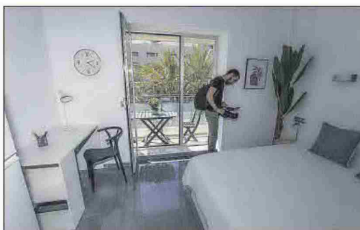
Algunas de las habitaciones cuentan, incluso, con terraza.