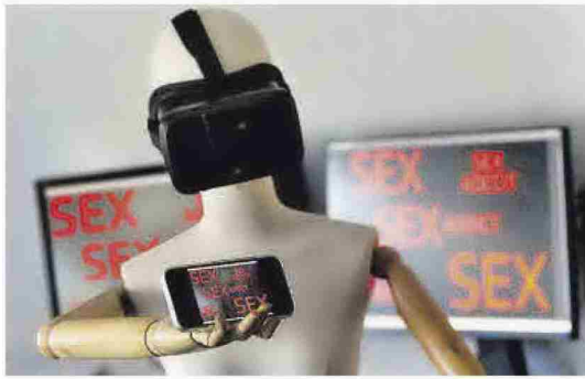
El acceso a Adisex es gratuito.