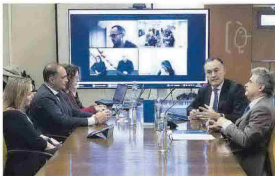
El acto fue al mismo tiempo telemático y presencial.