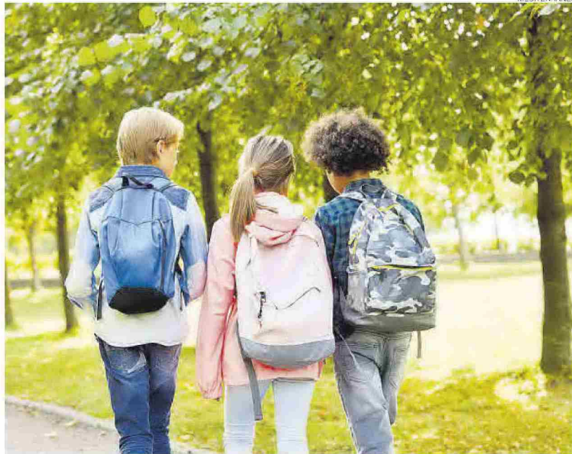
Más de 17.000 estudiantes de la provincia de Castellón son de origen extranjero.

Igualmente, desde la ONG Un Solo Corazón señalan que está viniendo muchísima gente de Co-