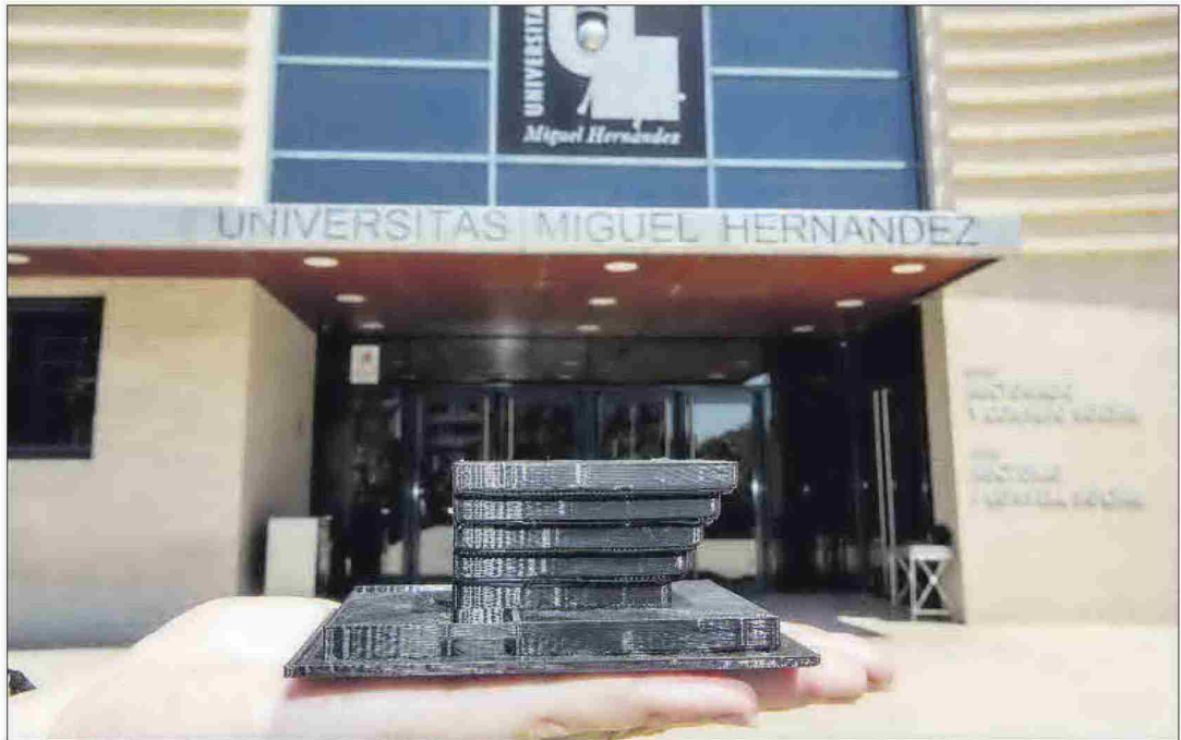
La Universidad Miguel Hernández es la que sale mejor parada de la auditoría del órgano fiscalizador autonómico.

Sostiene el órgano financiero autónomo que también es necesario determinar los porcentajes máximos de remuneración que debe percibir cada uno de los profesores por cada contrato de investigación, y que para ello se hace