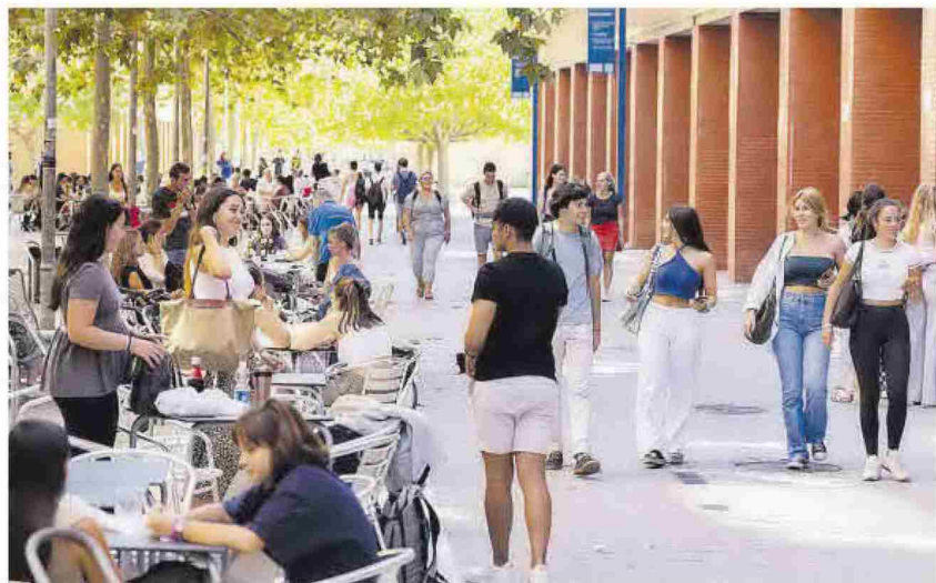
Diversos grupos de universitarios en el Campus de Tarongers de la UV.