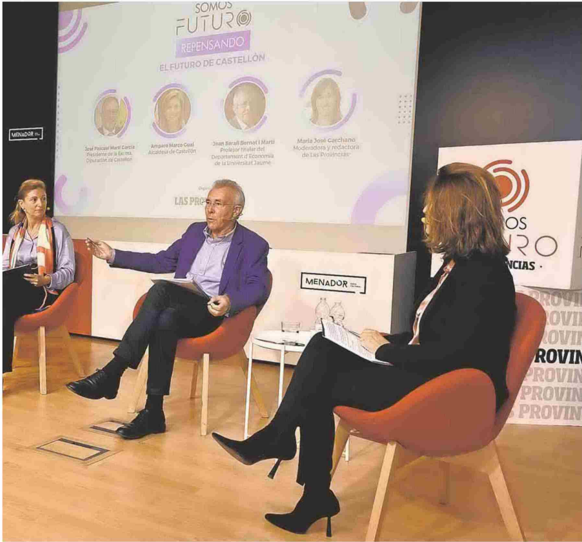
A lo largo de la mañana, los ponentes debatieron sobre los retos de futuro de Castellón. JOSÉ IGLESIAS

zar y el Corredor debe ser una prioridad gobierne quien gobierne».