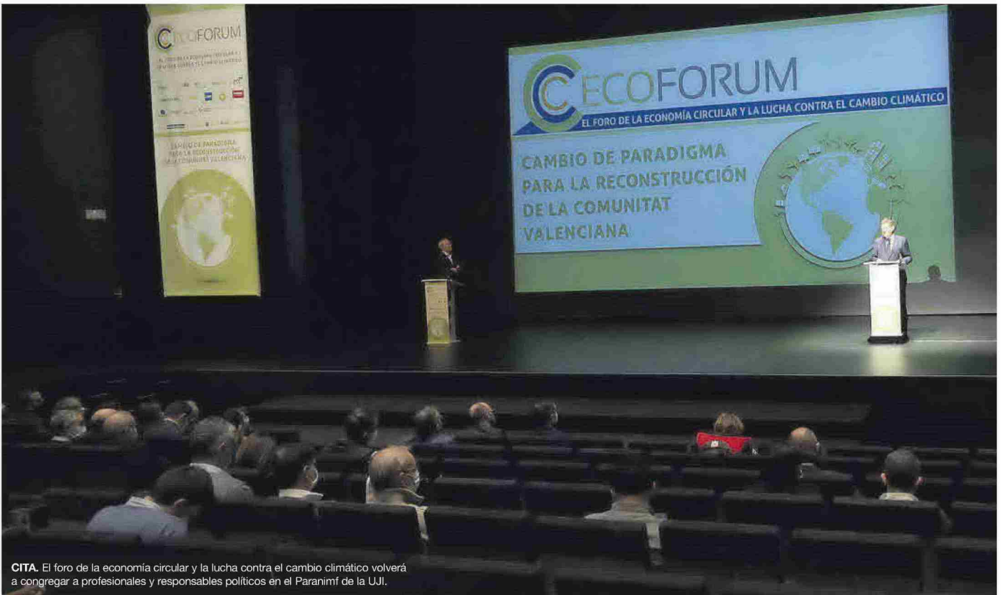
CITA. El foro de la economía circular y la lucha contra el cambio climático volverá a congregarse a profesionales y responsables políticos en el Paraninf de la UJI.

LA CUARTA EDICIÓN DEL EVENTO SE CELEBRA HOY Y MAÑANA EN LA UJI