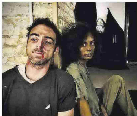
'Tardigrads', dirigida per Sergio Caballero, una proposta atractiva.