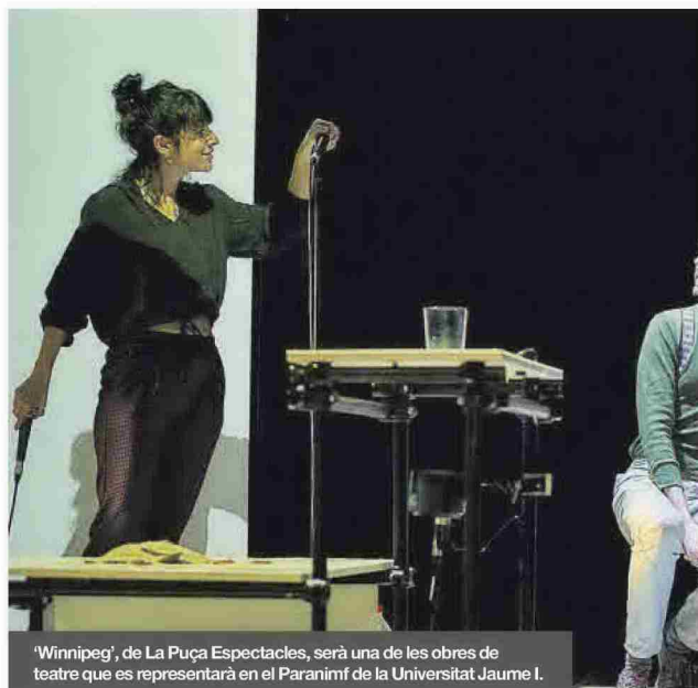
'Winnipeg', de La Puça Espectacles, serà una de les obres de teatre que es representarà en el Paranimf de la Universitat Jaume I.

En quant a espais escènics, el Paranimf tindrà un àmplia programació entre la que destaquen les obres Winnipeg , de Puça Espectacle, una representació que tracta el tema de la memòria històrica i que exposa l'exili de 2.000 republicans espanyols que es van exiliar a Xile i que es va anomenar Els fills de Neruda; El Avaro , amb la qual la companyia Atalaya vol commemorar el 400 aniversari del naixement del dramaturg francès Molière; Memoria eraikiz - Flores en el asfalto , de la companyia vasca Hortzmuga Teatro, una instal·lació artística multidisciplinària que proposa un viatge emocional amb l'objectiu de sensibilitzar sobre la violència masculista (només 30 persones per re-