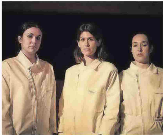
'Retrat[s]' és una altra de les peces que s'emmarquen dins del Reclam.

presentació); El Búho , una obra de Titzina Teatre, que aprofundeix sobre les malalties mentals o Escolta'm , una producció de la Universitat de València que posa èmfasi en el suïcidi, per a donar visibilitat a una problemàtica que ha sigut tabú durant molts anys.