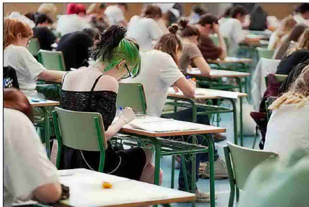
Estudiantes realizan la Selectividad en La Rioja.

haya pruebas separadas de las distintas asignaturas, como ocurre ahora. «Un solo ejercicio de madurez que abarque diversas materias pierde objetividad respecto a la evaluación. Y se puede constatar perfectamente la madurez académica del alumnado mediante ejercicios de cada materia», defiende la Comunidad de Madrid.