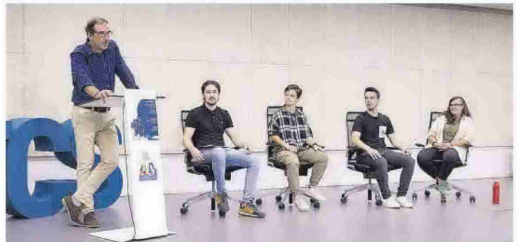
UJI. El decano de la facultad de Salud, ayer, durante un coloquio en la UJI sobre las necesidades de salud mental de la comunidad universitaria dentro de la Semana de la Salud Mental.