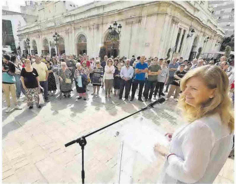
CASTELLÓN. La alcaldesa de Castellón, Amparo Marco, participó ayer en la lectura del manifiesto del Día Mundial de la Salud Mental en la plaza Mayor, junto a la diputada Patricia Puerta y cargos de la asociación de familiares Afdem.

DISCRIMINACIÓN // Por su parte, los afectados se mostraron en contra de la discriminación: «Las personas con enfermedad mental nos negamos a ser ciudadanos de se-