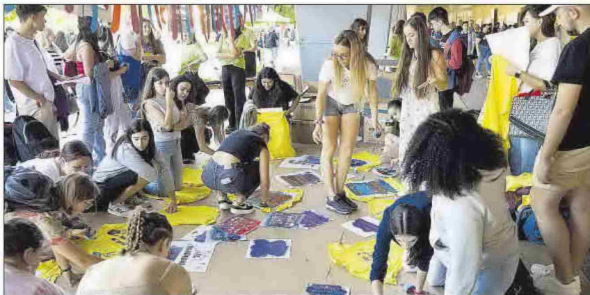
Taller de creación de camisetas multilingües.