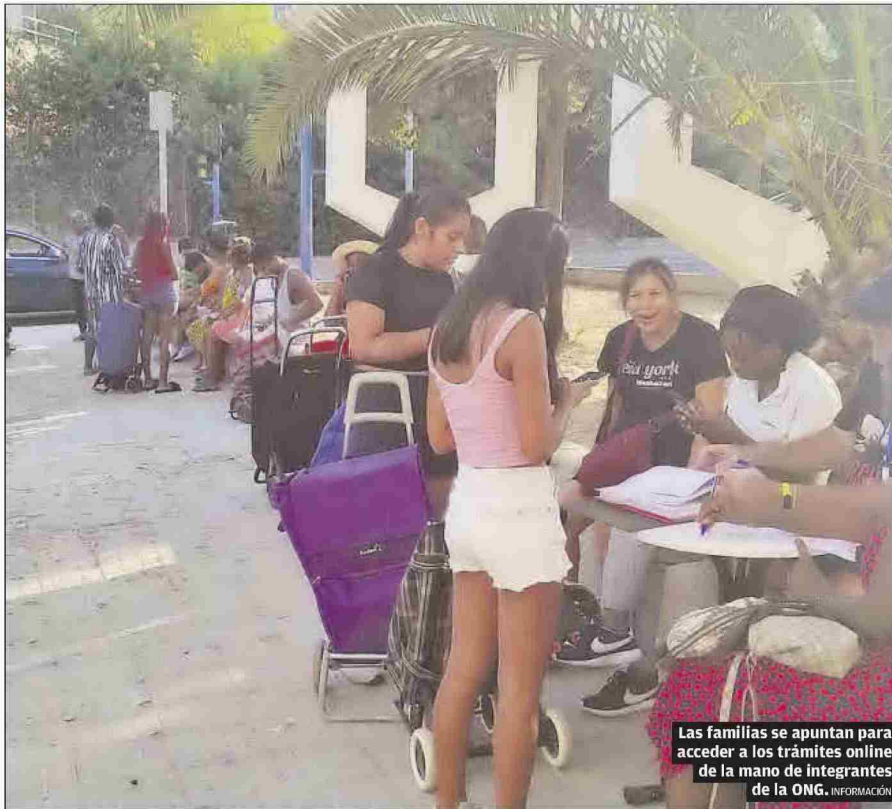
Las familias se apuntan para acceder a los trámites online de la mano de integrantes de la ONG. INFORMACION