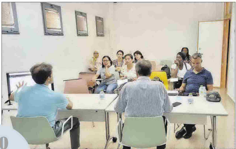
El técnico de transferencias y el investigador explican la app a enlaces del barrio.