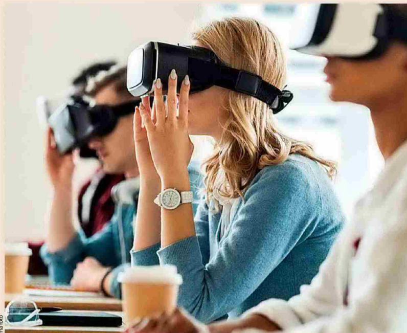
Una de las ventajas de este modelo de aprendizaje es la mejora del rendimiento de los estudiantes.