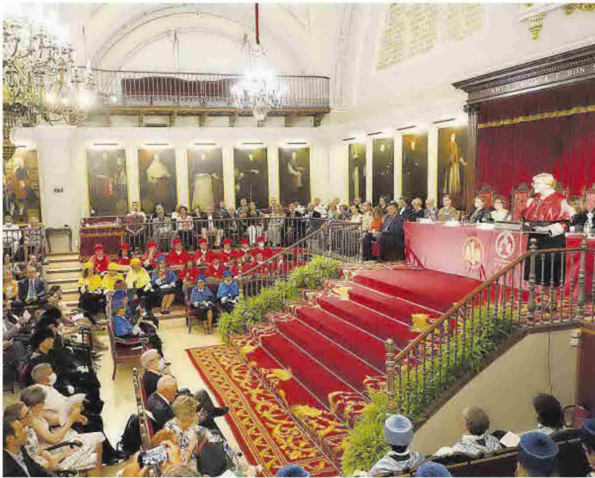
El Paranimf, en la Nau, lleno de nuevo, ayer, en el acto de inauguración del curso.