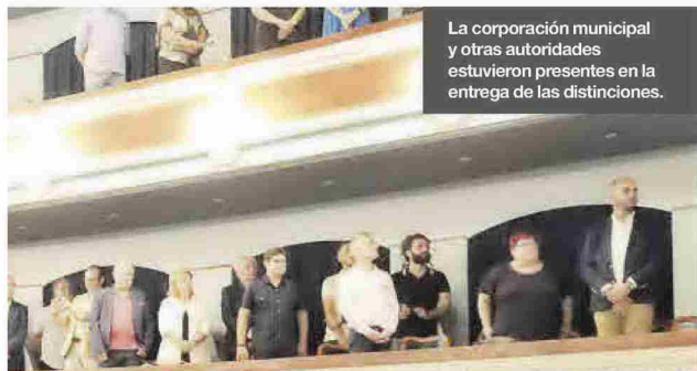
La corporación municipal y otras autoridades estuvieron presentes en la entrega de las distinciones.