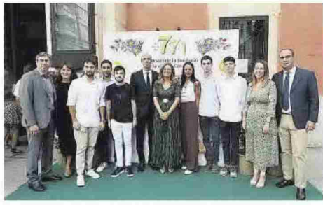
Los invitados al acto posaron en la entrada del teatro antes de los diferentes reconocimientos a los protagonistas de la cita.