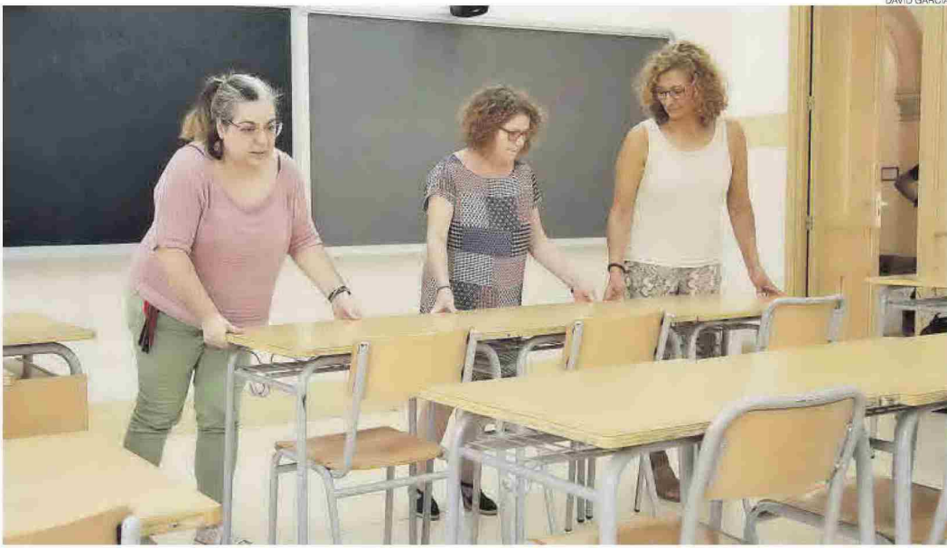
Los centros educativos, como el IES Francesc Ribalta de Castelló, trabajaban ayer en los preparativos para el inicio del curso académico el próximo lunes.

► La ratio media de las aulas volverá a reducirse este curso con el in-