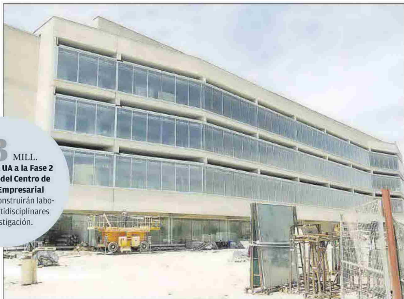
Edificio de Empresas del Parque Científico de la Universidad de Alicante.

► El Consell invertirá más de 10 millones de euros en las universidades de la provincia hasta 2024 para levantar infraestructuras para innovación