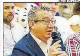
TONI PÉREZ ALCALDE DE BENIDORM

«Mi argumento contra la tasa es por una cuestión de ética: nunca penalizaría a alguien que nos elige»