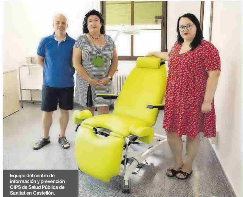
Equipo del centro de información y prevención CIPS de Salud Pública de Sanitat en Castellón.

Especialistas de Sanitat indican que «las ITS como la gonorrea,