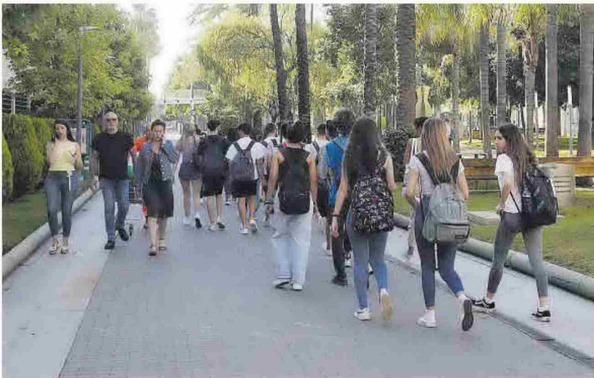
Varios grupos de estudiantes caminan por el campus de Vera de la UPV, en València.