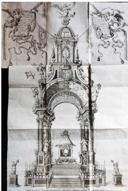
Catafalco de Maria Luisa de Orleans cathedral de Valencia, 1689

instituciones provinciales, autonómicas o ultramarinas, y sociedades estatales. En sus aspectos formales casi todos estos libros quedaron bastante dignos, pero a todos les encontré algún defecto que me dejó insatisfecho –a veces pequeño y otras no tanto- y que fueron fruto de la escasa profesionalidad de algunas editoriales, de mi torpe vigilancia del proceso, de las limitaciones del presupuesto o del diseño de la colección.