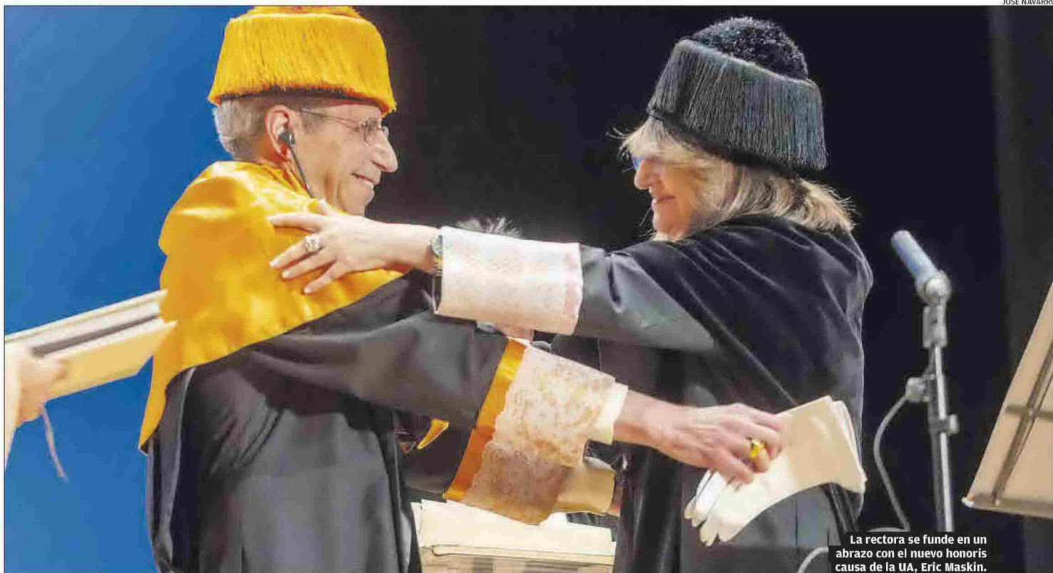
La rectora se funde en un abrazo con el nuevo honoris causa de la UA, Eric Maskin.