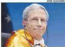
ERIC MASKIN ECONOMISTA. HONORIS CAUSA DE LA UA

« No me cabe la menor duda de que nuestras dos universidades seguirán colaborando »