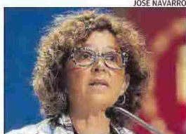
JOSEFINA BUENO CONSELLERA DE UNIVERSIDADES

« Los grados no son de nadie sino de toda la sociedad, sea cual sea su origen universitario »