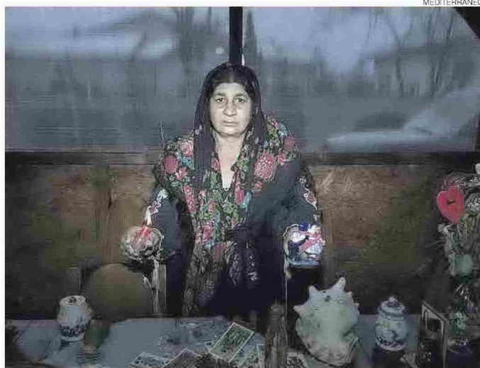
Al Museu Etnològic de Castelló es veurà la mostra de l'artista catalana Silvia Prió.