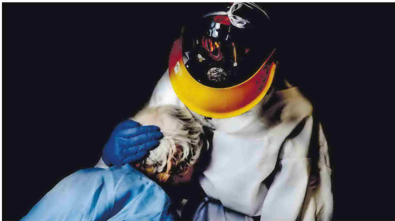
'Historias de una pandemia' és el títol del treball de la fotògrafa documental Núria Prieto, que es pot veure des del passat 7 d'abril a la sala d'etnologia del Museu de Belles Arts de Castelló.