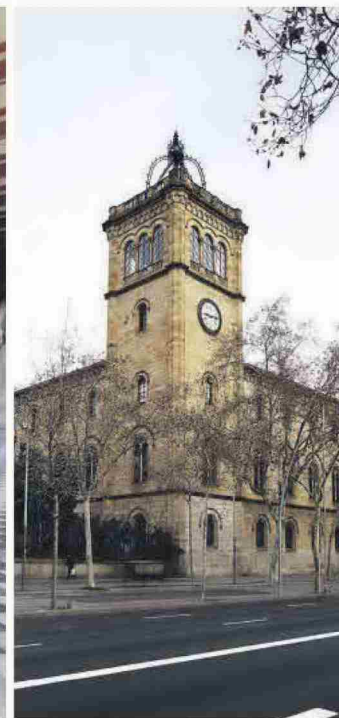
Imagen del claustro y la fachada de la UB. Abajo, el Aula Magna.