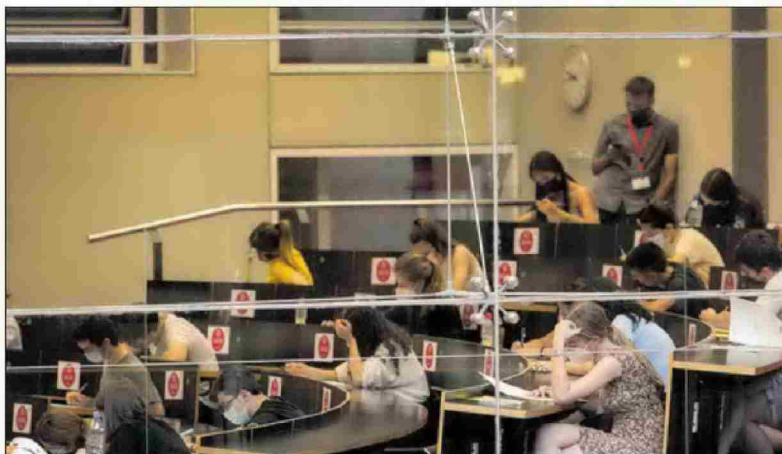
Pruebas de Selectividad en la Universidad Pompeu Fabra de Barcelona, en junio de 2021.

IGNACIO ZAFRA, Valencia La Selectividad del año pasado alcanzó un récord de aprobados (92,7% del total de presentados y 94,6% entre los que procedían del Bachillerato) y mantuvo importantes diferencias territoriales. Los datos oficiales reflejan que el porcentaje de aptos difirió hasta en 7,7 puntos porcentuales entre las comunidades. La distancia entre las notas medias llegó a ser de hasta un punto. Cada autonomía organiza sus pruebas de Selectividad, pero el distrito universitario es único. Es decir, que un alumno puede matricularse en una carrera en cualquier facultad de España al margen de dónde haya realizado las pruebas de acceso a la Universidad. Y la competencia por acceder a ciertas titulaciones se decide en muchos casos por milésimas.