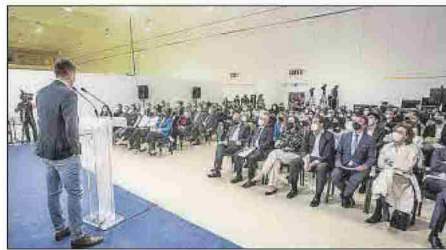
Un momento del acto de homenaje en el museo.