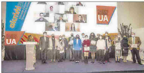
Alumni Embajadores en la pantalla y sus familias.