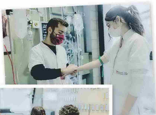
LOS ALUMNOS DE LAS DIFERENTES ESPECIALIDADES TIENEN LA POSIBILIDAD DE REALIZAR PRÁCTICAS PARA COMPLETAR SU FORMACIÓN TEÓRICA. BLANQUERNA-URL

Destacan los talleres “Típs para las PAP. Herramientas y estrategias para superar las PAP” y “La profesión del logopeda”, que se impartirán el viernes 18 a partir de las 12 h, ambos organizados por la Facultat de Psicologia, Ciències de la Educació i el Deporte. También el viernes, pero por la tarde, profesorado de la Facultat de