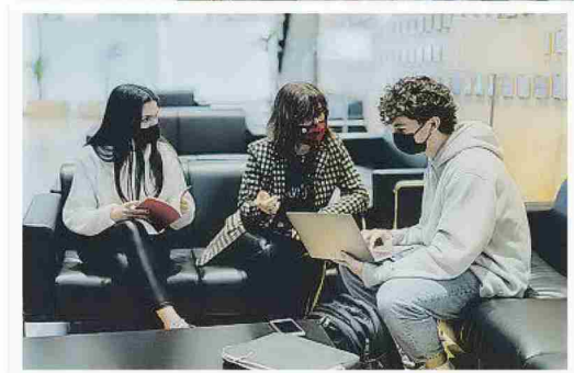
EL PROFESORADO LLEVA A CABO UN SEGUIMIENTO INDIVIDUALIZADO DEL ALUMNADO. BLANQUERNA-URL