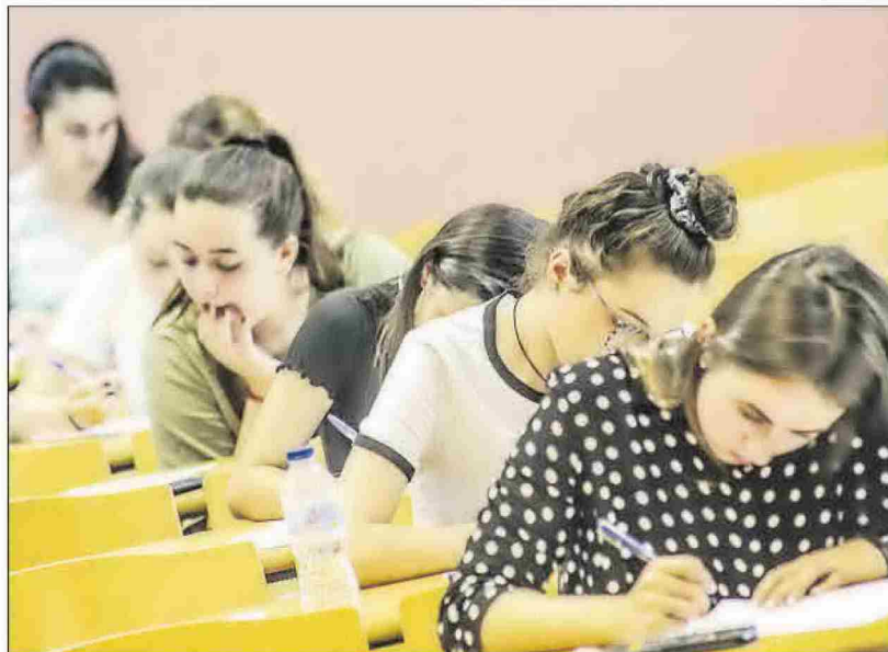
Alumnas de la Universidad de Alicante y de la Universidad Miguel Hernández de Elche.

Más allá de esta cuestión, Establier pone otros asuntos sobre la mesa. «La brecha salarial provoca que las mujeres cobremos un 20% menos que los hombres y a ello le sumamos los techos de cristal o la conciliación de la vida familiar, que sigue siendo un pro-