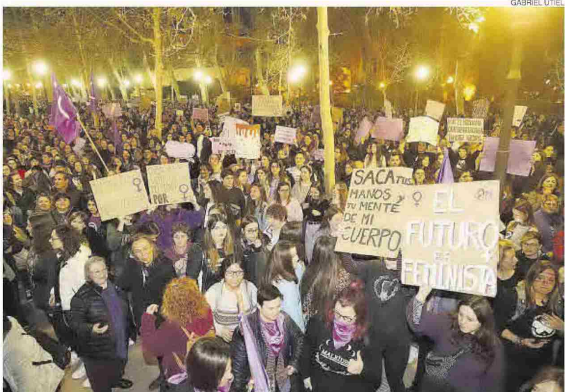
Imagen de la manifestación multitudinaria celebrada en el 2020 por las calles de Castelló, antes del confinamiento.

Asimismo, la tasa de actividad femenina fue del 49,2% en el 4º trimestre del 2021, según la Encuesta de Población Activa, y la tasa de ocupación se sitúa en el 42,6%, con 14 puntos de diferencia frente a los varones. Además, el 66,29% de contratos temporales y a tiempo parcial son para las mujeres.